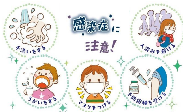
【本校のインフルエンザ発生状況（R5・R6）】

令和5年度、令和6年度は12月をピークにインフルエンザが流行しました。発熱での欠席や早退するお子さんも少しずつ増えてきましたので、毎朝ご家庭で健康観察していただき、体調がすぐれないときは無理のない登校をお願いします。