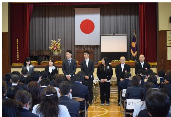
入学式の様子（担任紹介）

今年度の新1年生は54名です。高等部全体で164名。昨年度より30名以上少なくなり、これまでの大きな大きな学校とは少し違った高等部になる予感がします。これまで以上に一人一人に寄り添い、高等部卒業後の生活に向けてサポートしていきます。新しい高等部を新1年生と共にスタートします！